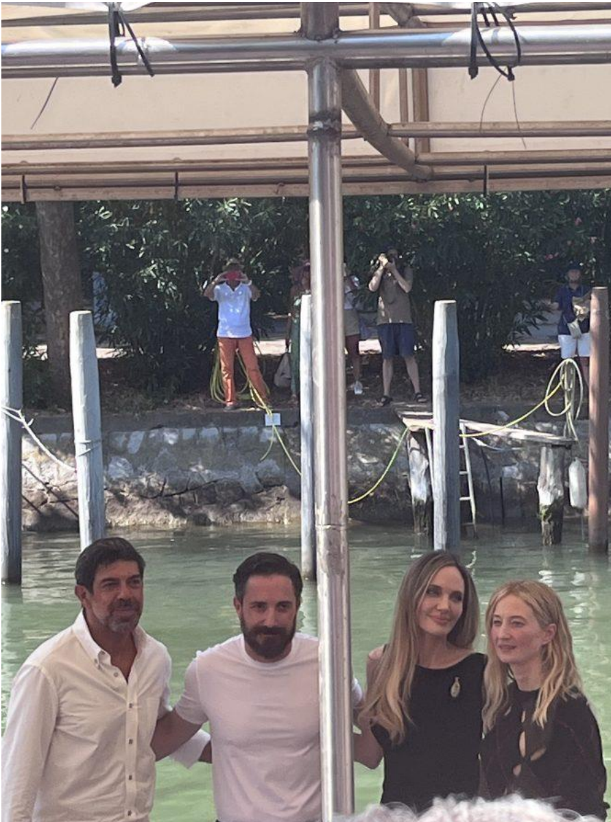
Il cast di "Maria" all'arrivo in darsena

Angelina Jolie, in conferenza stampa, ha raccontato come si è preparata per interpretare la Callas: "Ho studiato sette mesi, con disciplina e dedizione e poi ho provato prima in una piccola stanza con Pablo Larrain e i miei figli ad ascoltare, poi nel tempio della Scala di Milano. Quello che mi preoccupava era non deludere i fan della Callas. Ci sono registrazioni mentre insegna, ed io sono stata privilegiata, è stata la mia insegnante. Pablo mi ha poi protetta, mi ha permesso di entrare nelle emozioni. I brani musicali parlano molto del suo mondo. Non so se sia morta sapendo di essere amata. Ho reimpreso la parola diva attraverso Maria.