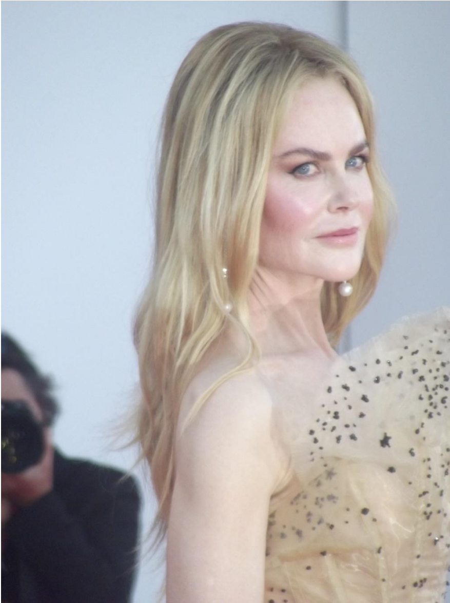
Il red carpet di Babygirl