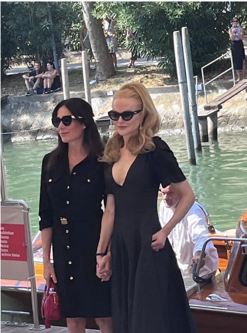
l'arrivo di Nicole Kidman con il cast di Babygirl in Darsena

“Sono una giovane donna progressista e credo che questo film esplori i limiti dell'essere donna. Per me è stato importante anche poter lavorare e parlare dell'industria cinematografica con Nicole Kidman, che ammiro molto. È stato un onore, ma ci siamo anche molto divertite. Siamo diventate amiche”, ha concluso Sophie Wilde.