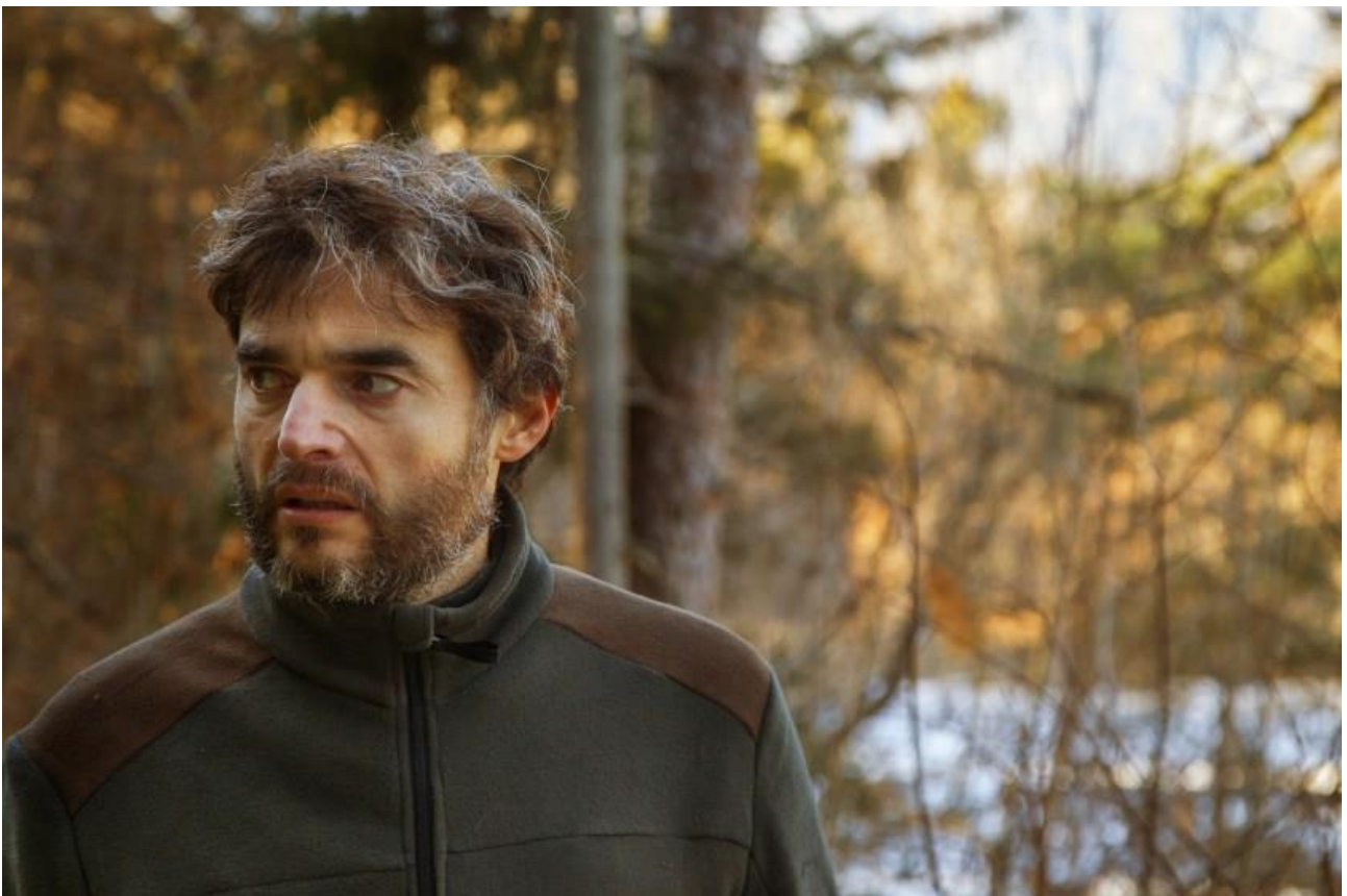
Paolo Briguglia in "Brennero"

Un periodo d'oro per Paolo Briguglia che, come ci ha raccontato, sta già lavorando a nuovi progetti sempre con quell'entusiasmo e quell'umiltà degli inizi e con la voglia di raccontare nuove storie che possano regalare emozioni e gli permettano di indagare le sfumature dell'animo umano.