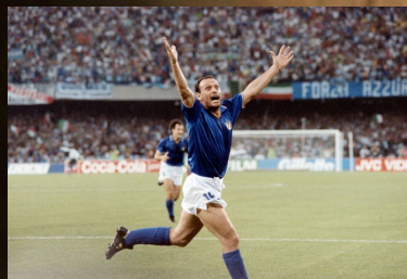
TOTÒ SCHILLACI, PER SEMPRE L'EROE DELLE NOTTE MAGICHE

E' UN PERIODO D'ORO PER L'ATTORE, SU RAI 1 CON "BRENNERO" E "I LEONI DI SICILIA" E SU CANALE 5 CON "I FRATELLI CORSARO"