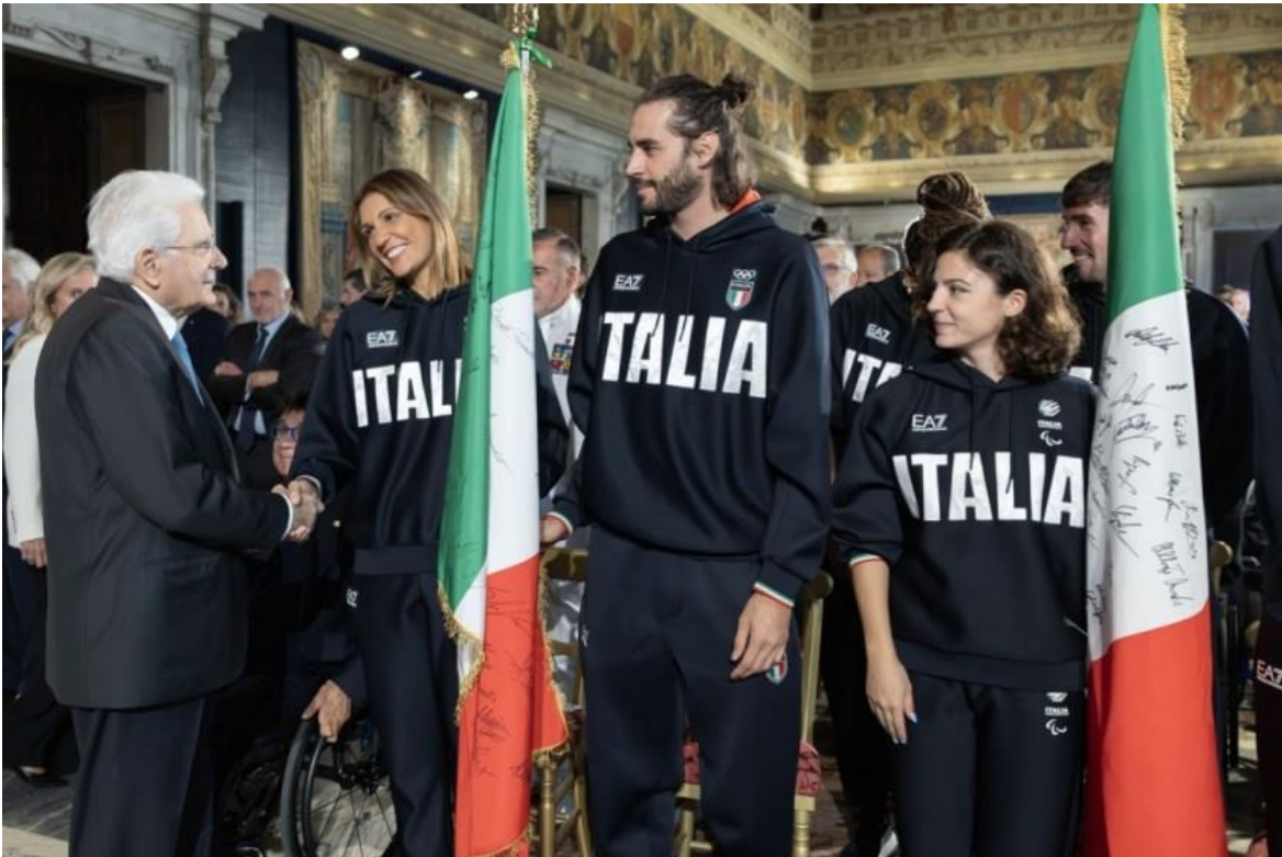
Gli Alfieri della squadra olimpica, Arianna Errigo e Gianmarco Tamberi, e l'Alfiere della squadra paralimpica, Ambra Sabatini, hanno restituito al Capo dello Stato le Bandiere nazionali con le firme degli atleti vincitori delle medaglie olimpiche e paralimpiche.