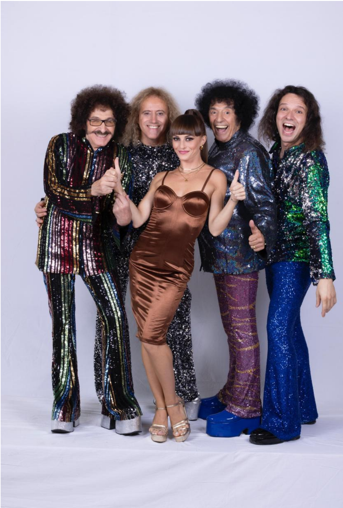
I Cugini di Campagna con Rebecca Gabrielli