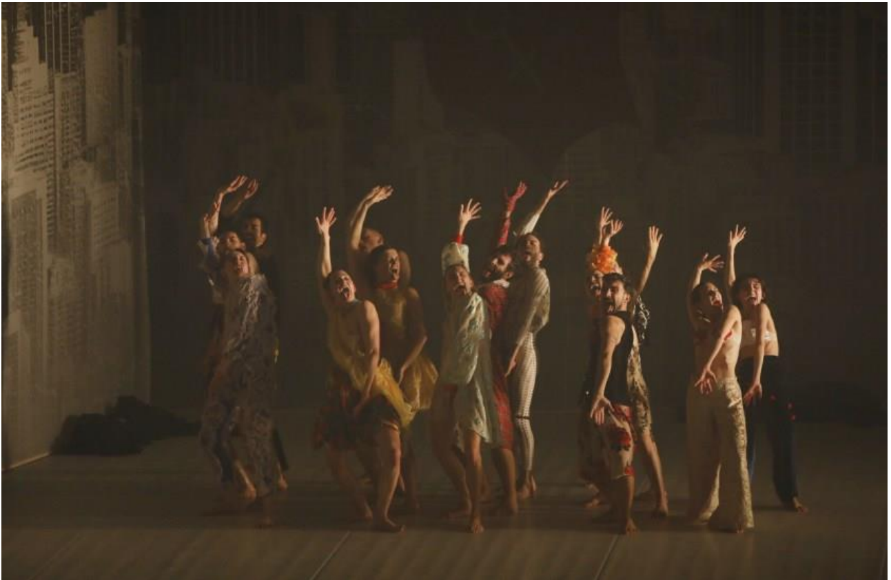
di Emanuela Cassola Soldati