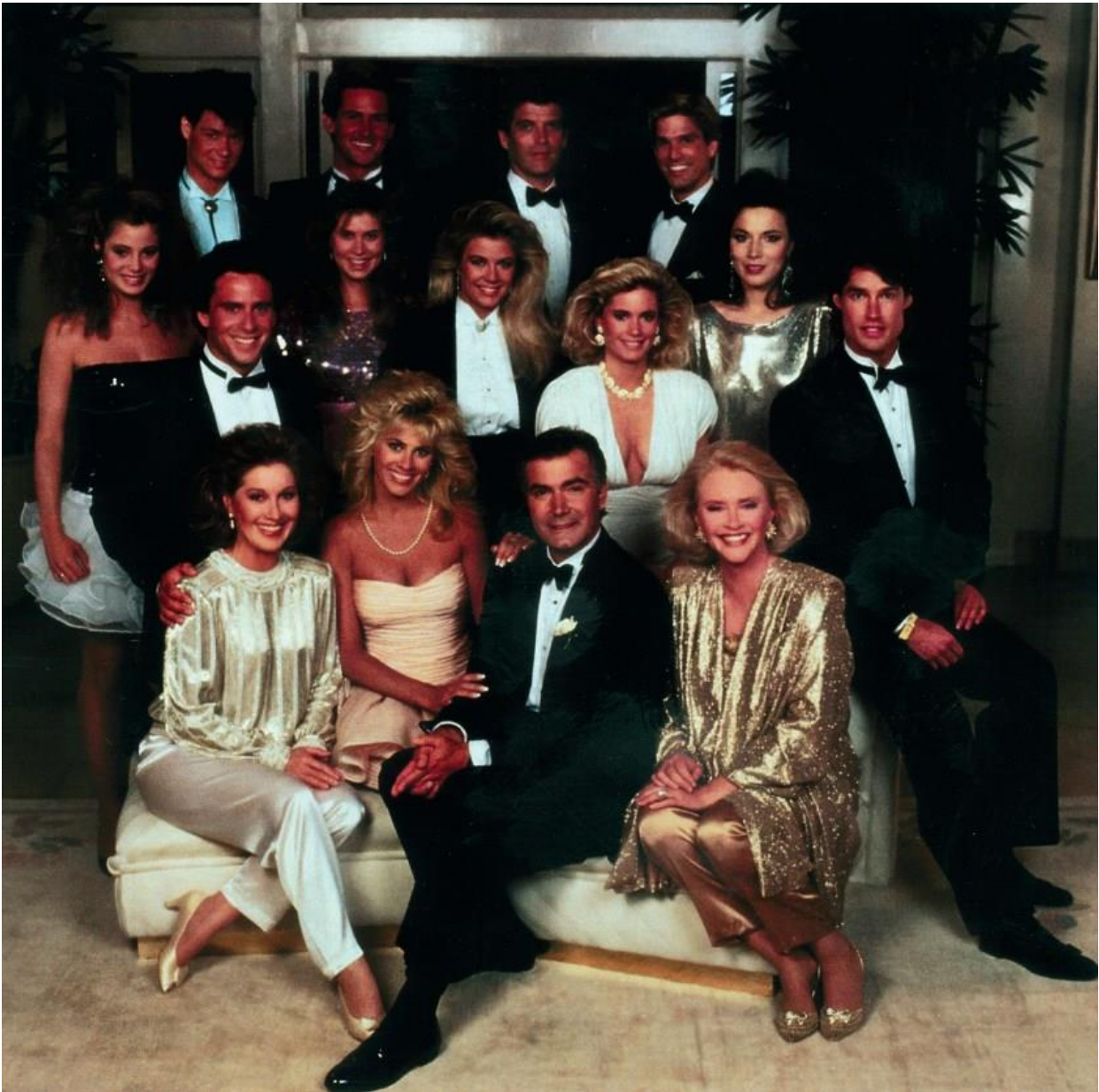
Katherine Kelly Lang sul set di "Beautiful" nel 1987