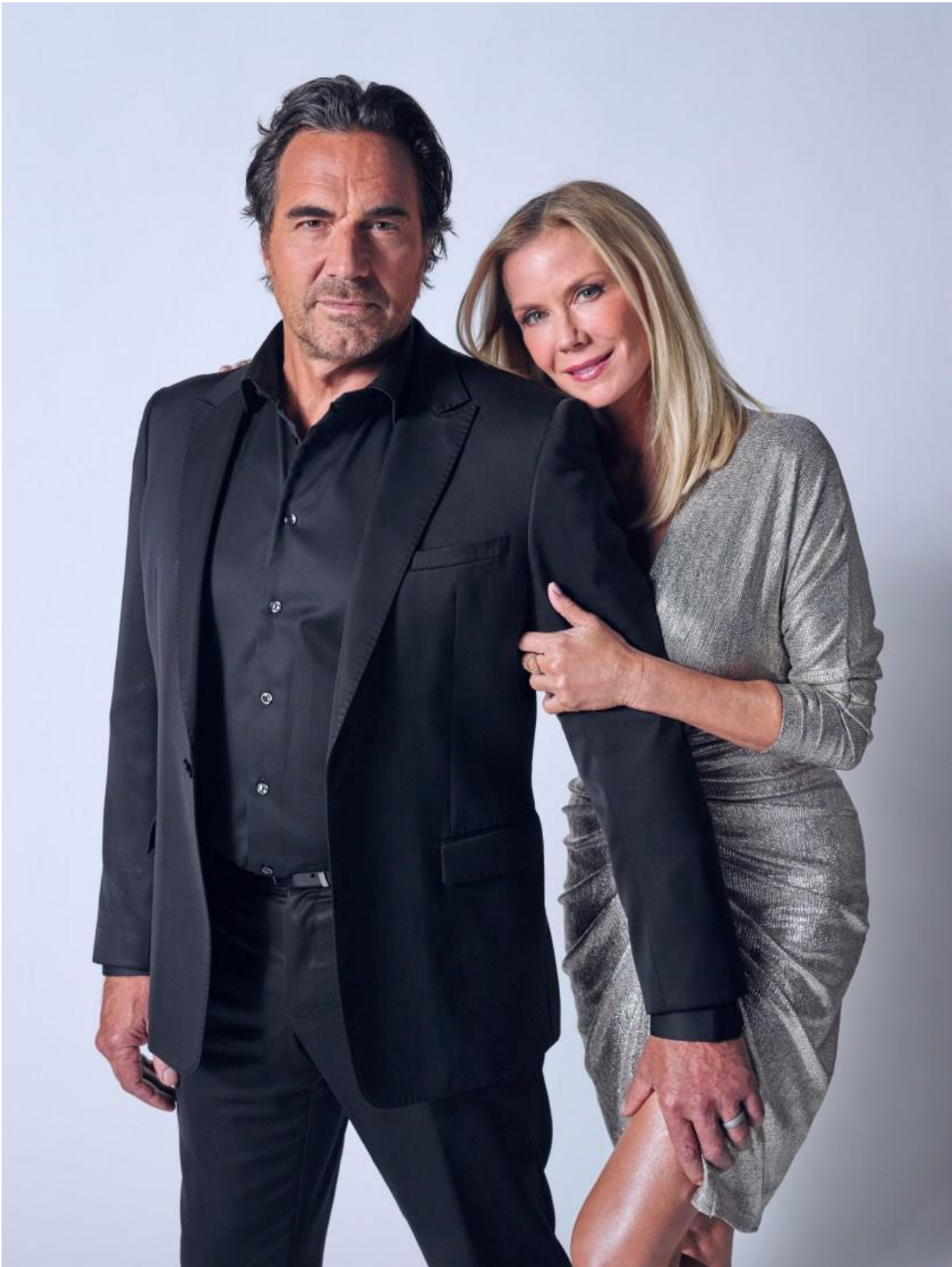
Katherine Kelly Lang con Thorsten Kaye