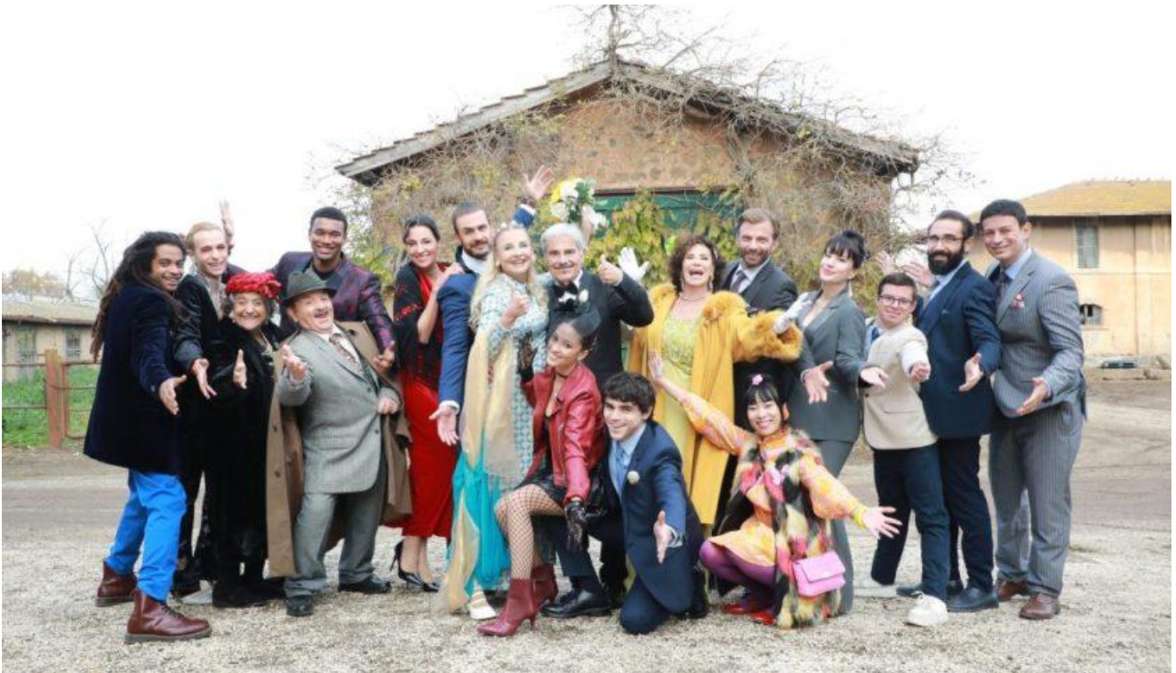
Barbara Bouchet e il cast di Fragili

“Poter rientrare nel mondo del cinema con un film di Martin Scorsese è stato bellissimo. Era un ruolo molto piccolo, con poche parole, ma sono stata entusiasta di interpretarlo”.