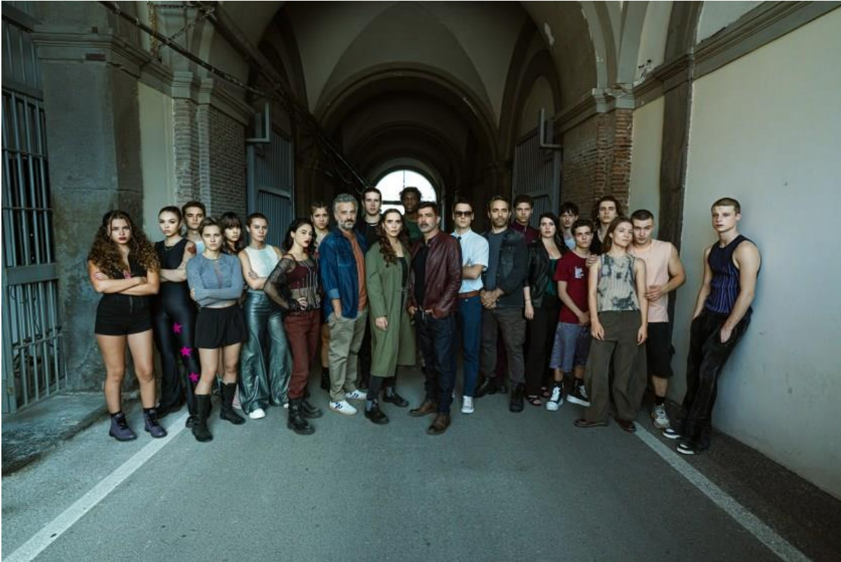
Carlotto Pinto e il cast di "Mare Fuori 6"

Noi tre sorelle siamo state un po' una sorta di scommessa ma abbiamo avuto un bellissimo riscontro. E' stata l'esperienza più bella della mia vita".